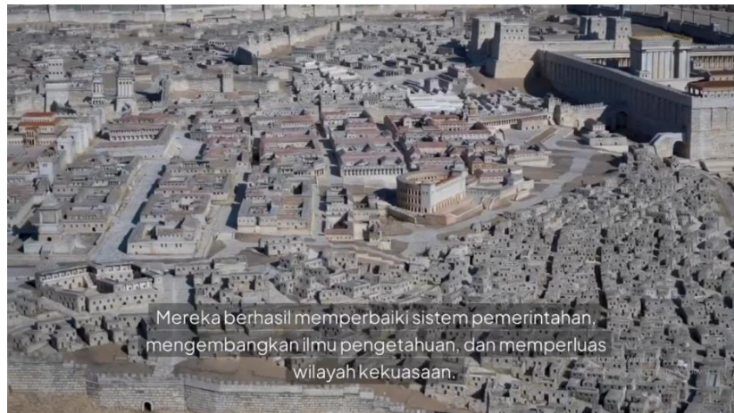
Gambar 1. Media Pembelajaran video