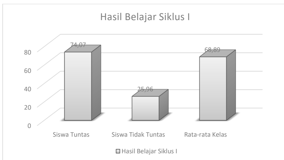
Grafik 4.2 Gambar Hasil Belajar Tes Siklus I