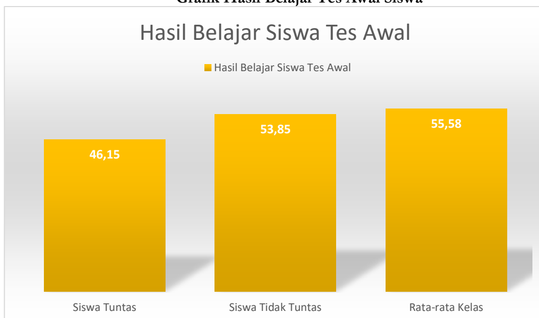
Gambar 4.1 Grafik Hasil Belajar Tes Awal Siswa

Dari tabel dan grafik diatas dapat dilihat bahwa kemampuan awal siswa dalam memahami materi Menghargai Perbedaan masih rendah, dari tes yang diberikan kepada 26 siswa diperoleh 14 siswa atau 53,85% yang mendapat nilai dibawah 65, sedangkan 12 siswa atau 46,15% yang mencapai nilai minimal 65 (syarat ketuntasan belajar peneliti) dengan rata-rata 55,58.